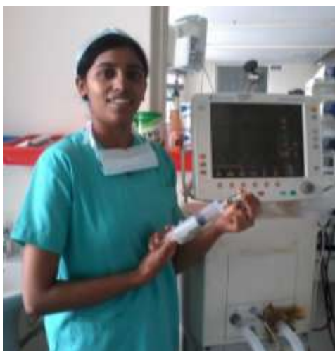
Efter studier till sjuksköterska har hon nu en tjänst i Bangalore