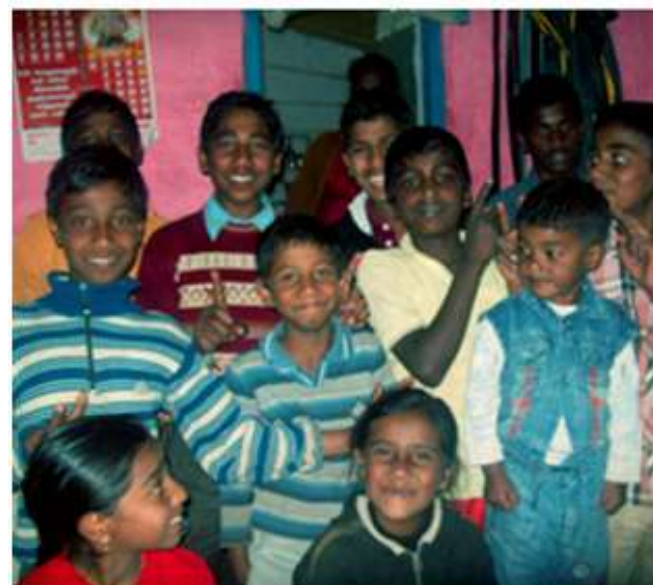
Alla barn vill gå i skola och bli någonting.