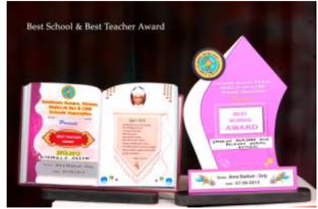
Smyrnaskolan i Kotagiri fick priser för bästa skola och bästa lärare utav 200 skolor med klass 1-5