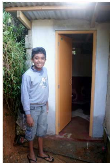
Tänk att få en egen toalett