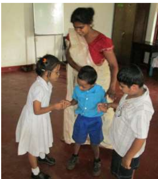
Barn med funktionshinder på Smyrnaskolan i Welimada