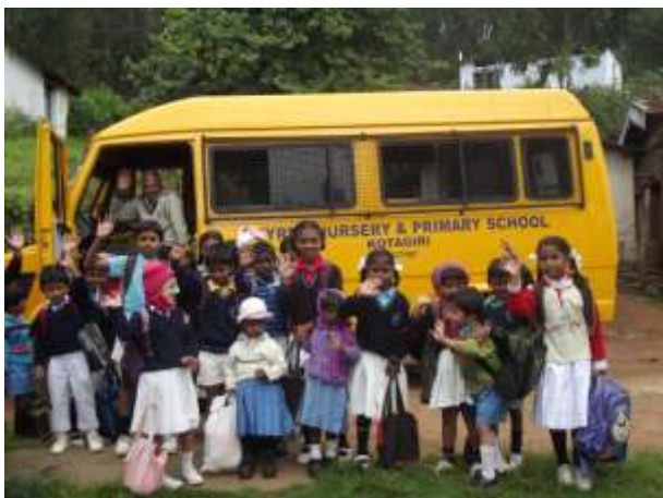
Bussen med barnen som hämtas från byarna till skolan på Smyrna, Kotagiri