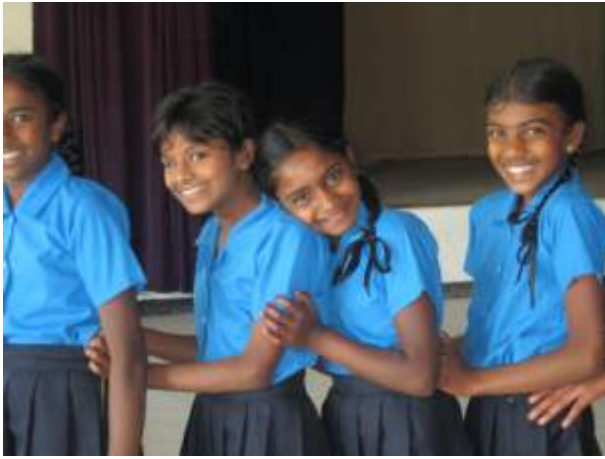
Skola för barn som aldrig fick en chans. Hit kommer flickor som även är 17 år.