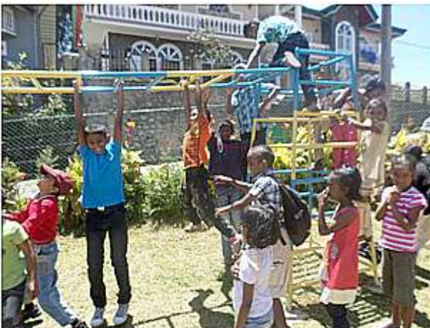
Genom extra gåvor kunde vi sätta upp lekplatser både i Indien och Sri Lanka till barnens stora glädje