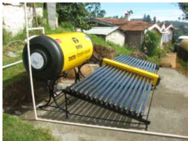
På Smyrna Home i Indien har vi satt upp solpaneler och behållare för varmvatten. Vi fick bidrag från Radiohjälpen